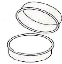
SAVON A RASER