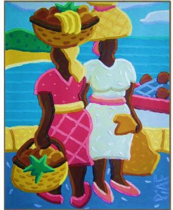
01 TI KAMO 'I LA DARSE

Je voudrais que la rose fût encore un rosier Et que le rosier même fût encore à planter ! La suit' de la chanson j' crois qu' je l'ai oubliée Si ça n' vous ennuie pas j'vais la recommencer ! Refrain